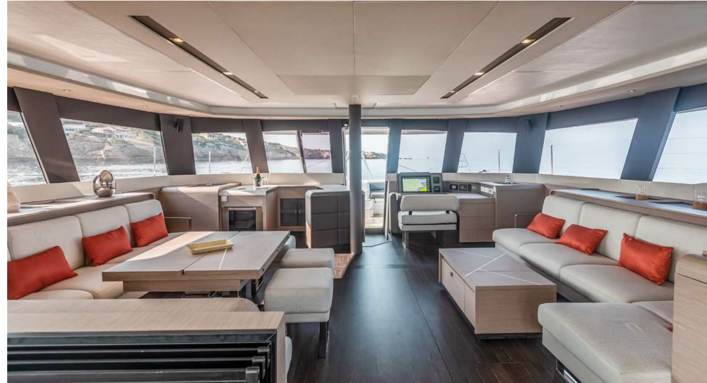
Galley down version