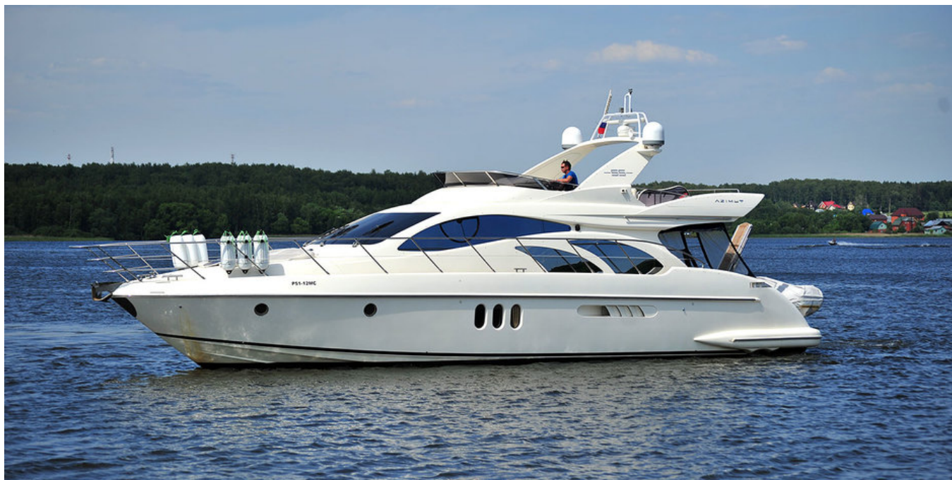
Экстерьер Azimut 55 - 2004