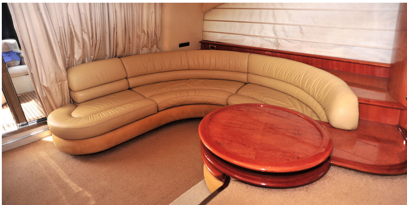
Диванная зона в кормовой части салона