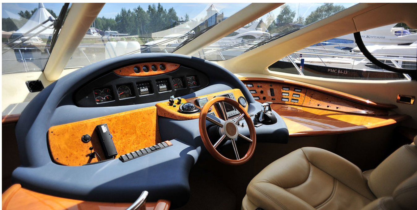
Главный пост управления