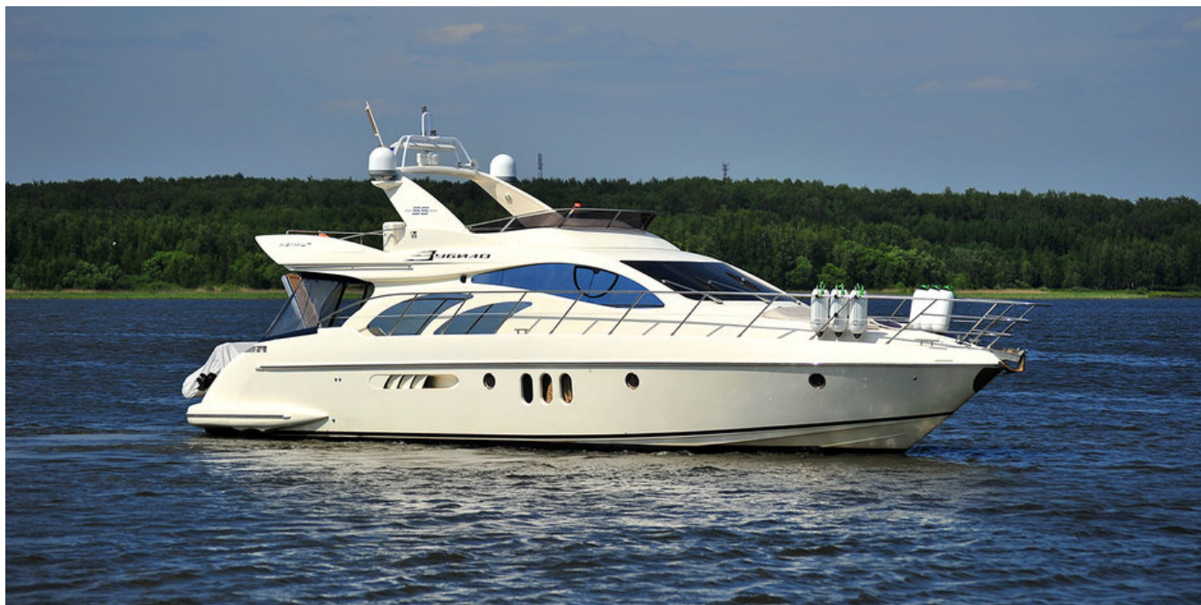
Экстерьер Azimut 55 - 2004