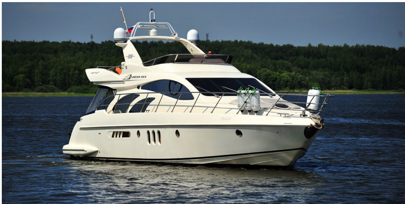
Экстерьер Azimut 55 - 2004