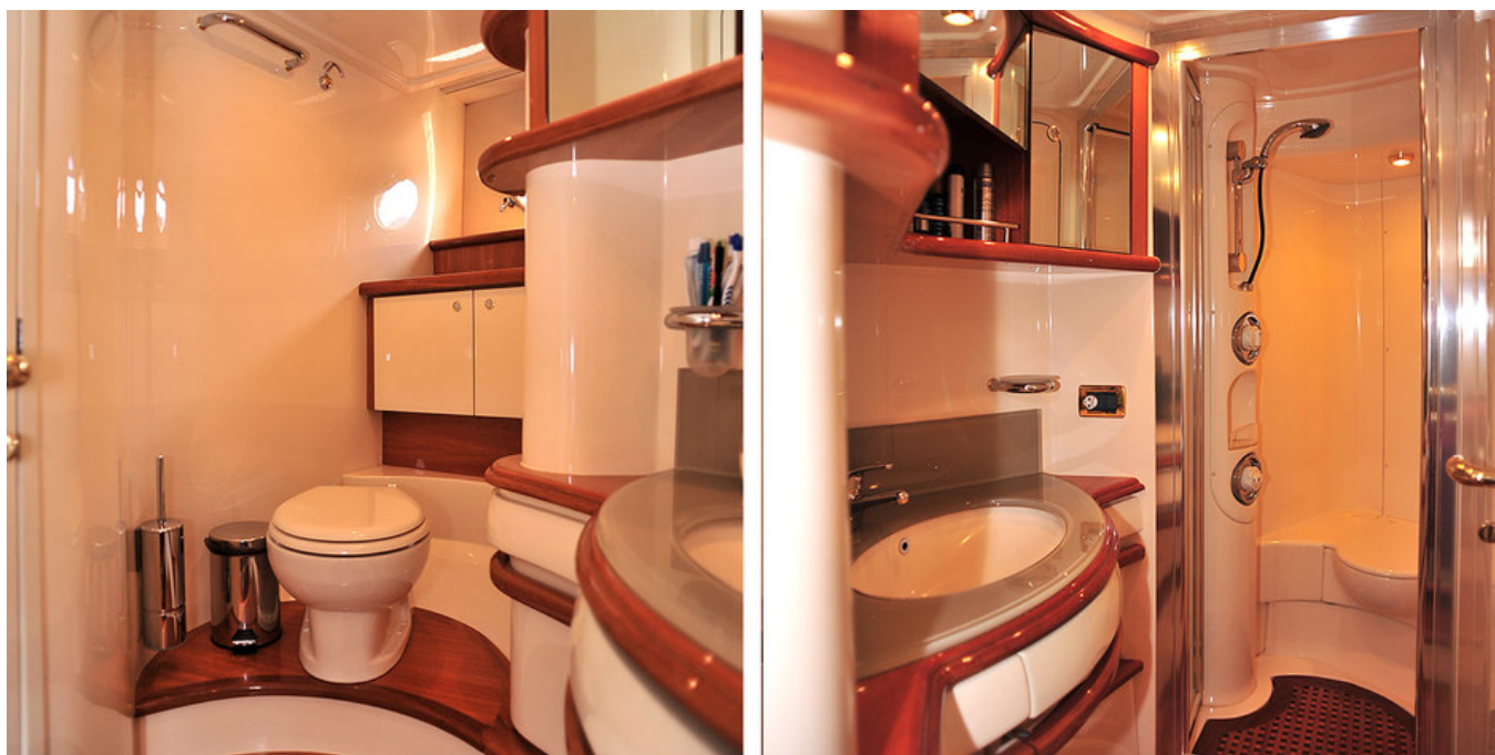
Ванная комната в каюте владельца