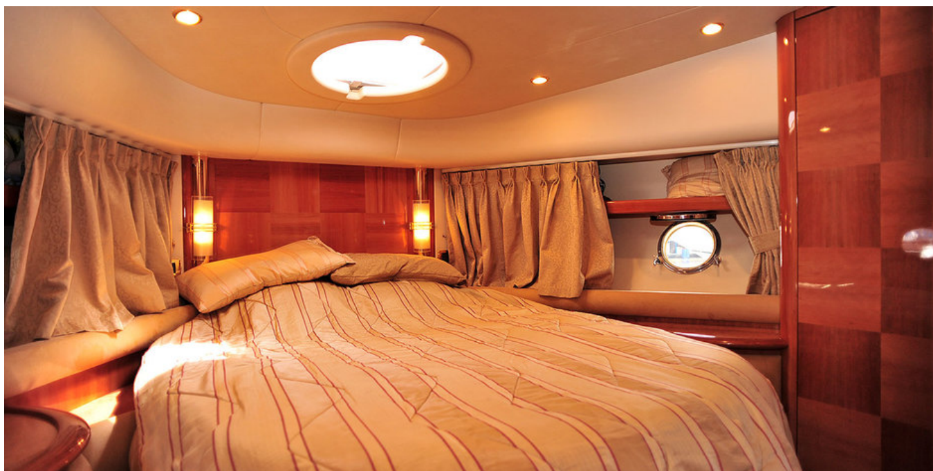
VIP каюта (носовая)