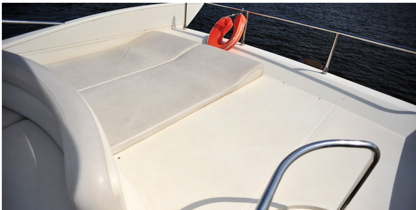
Лежаки в кормовой части флайбриджа