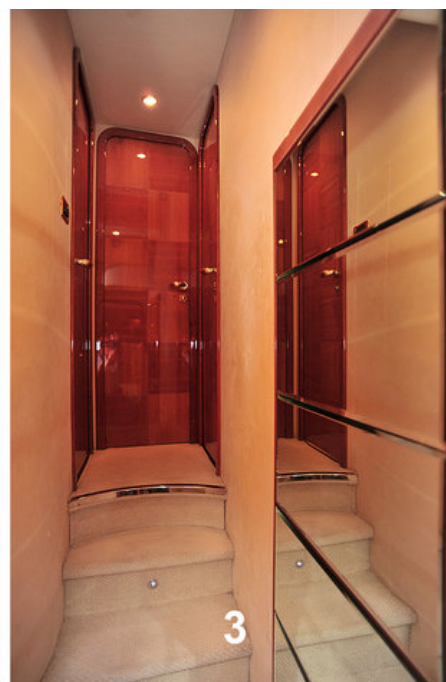
Лестница на нижнюю палубу (1, 2) и коридор (3)