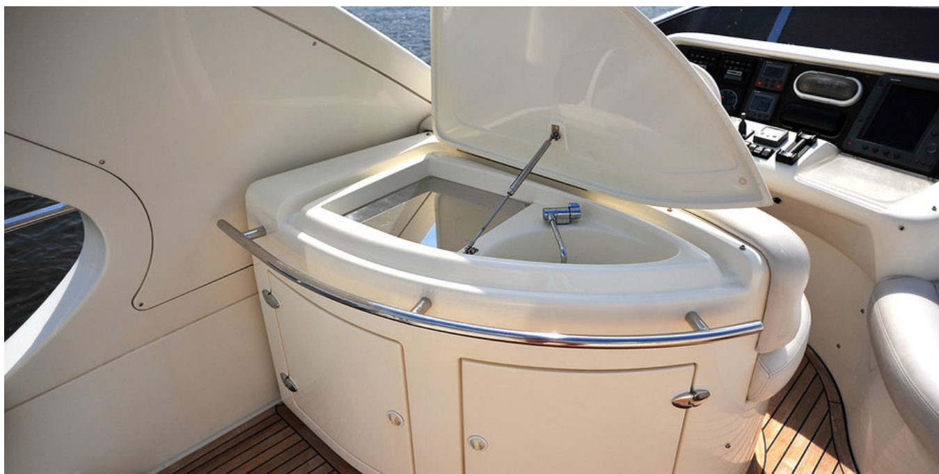
Мойка и бар на флайбридже