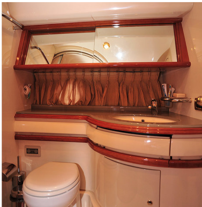
Ванная комната в VIP каюте