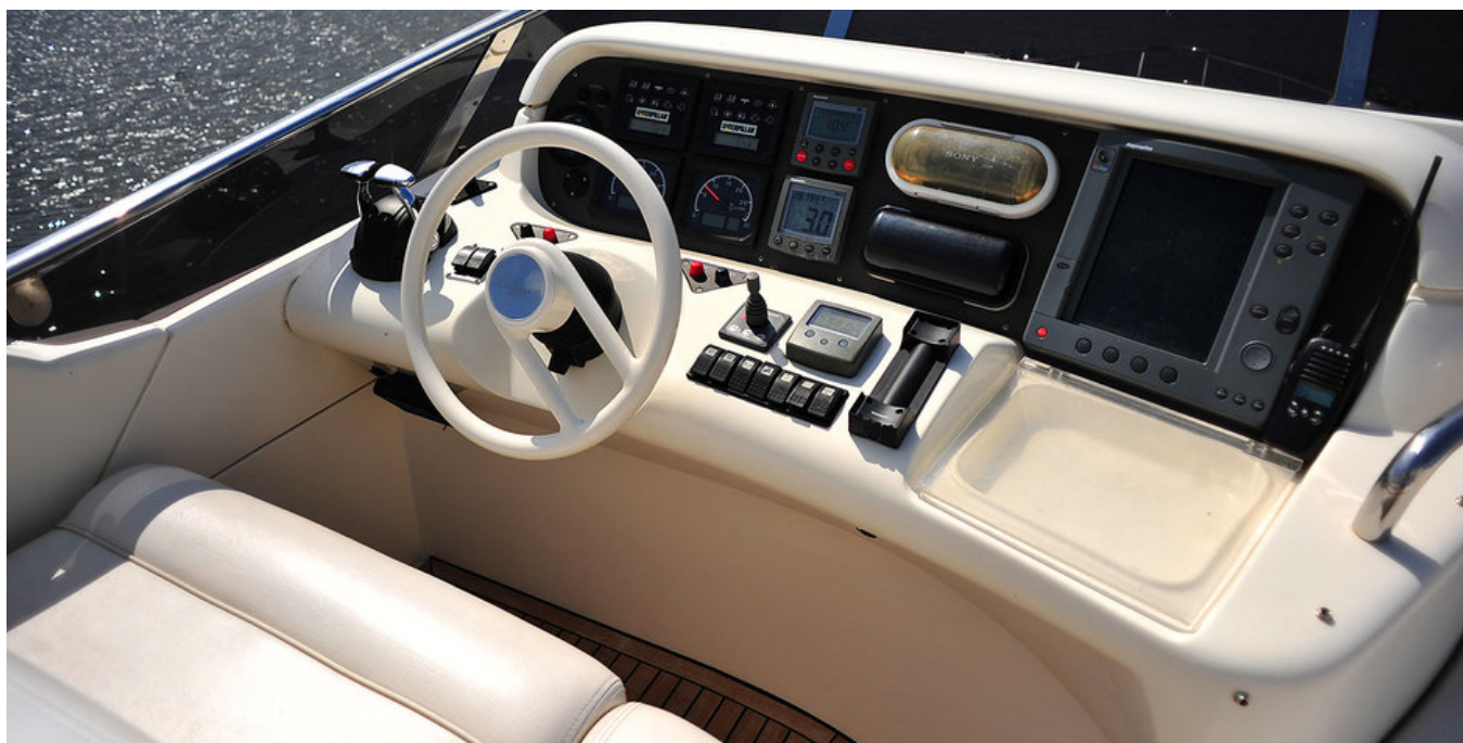
Пост управления на флайбридже