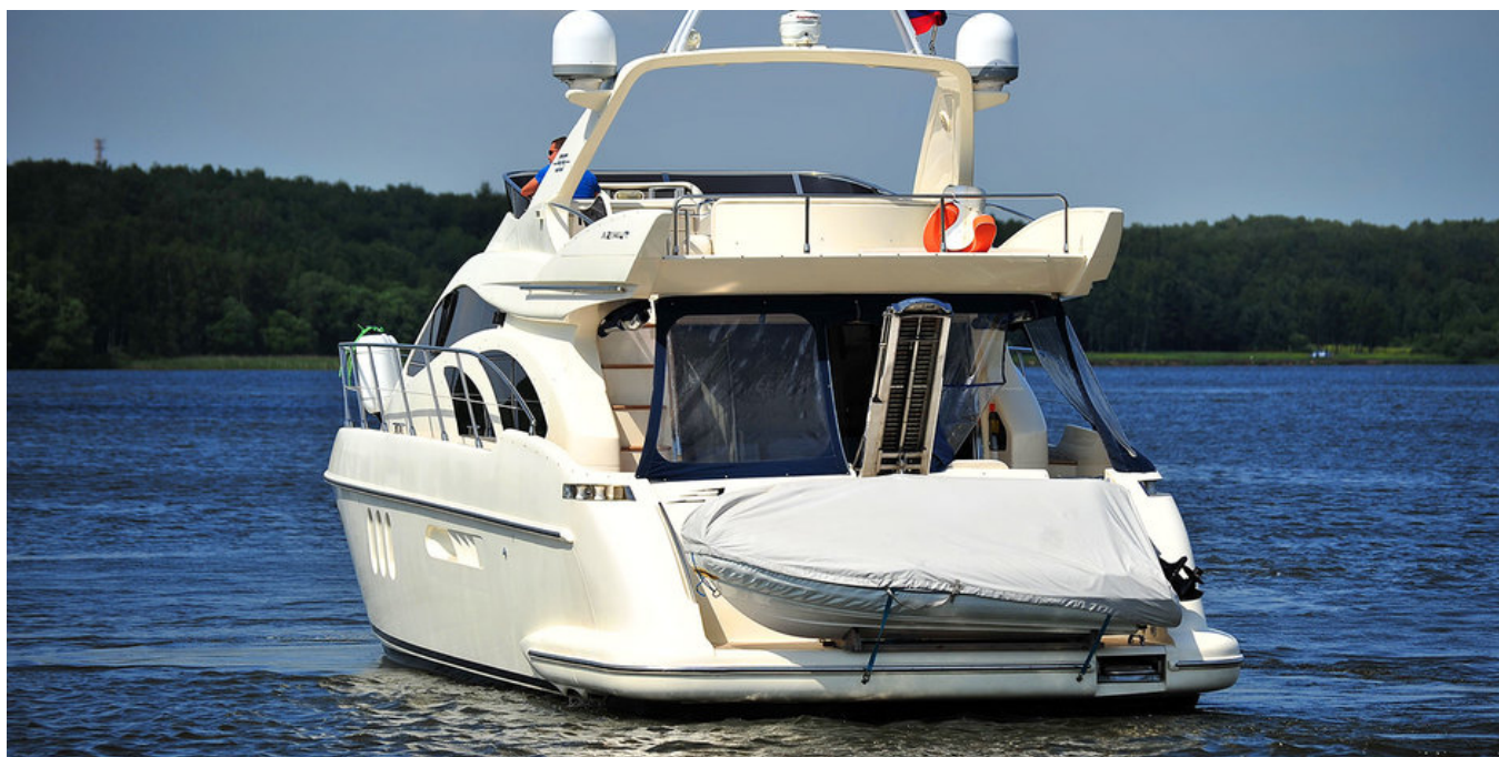
Экстерьер Azimut 55 - 2004