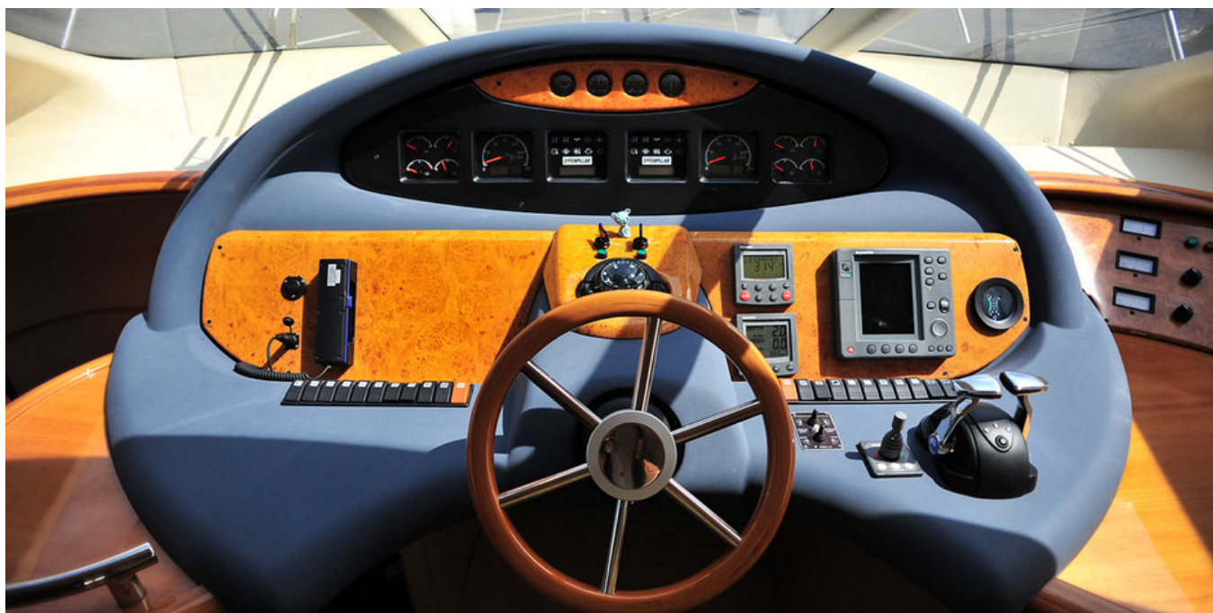
Главный пост управления