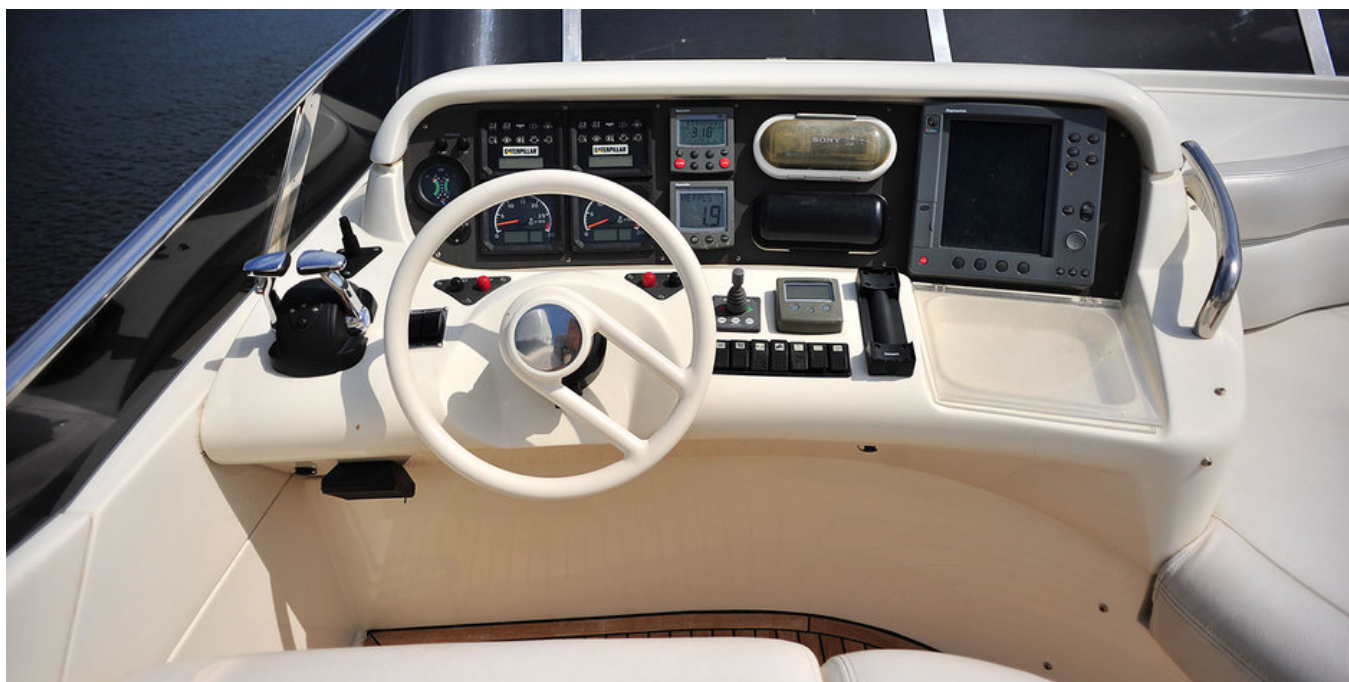
Пост управления на флайбридже