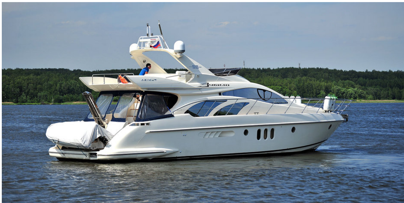
Экстерьер Azimut 55 - 2004