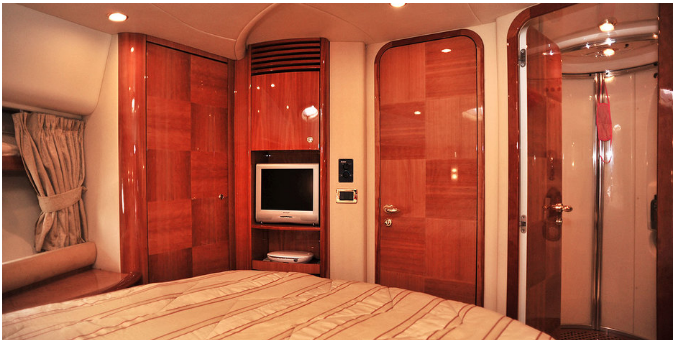
VIP каюта (носовая)