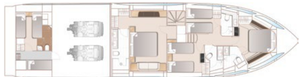
LOWER DECK - OPTIONAL TWIN BIRTH