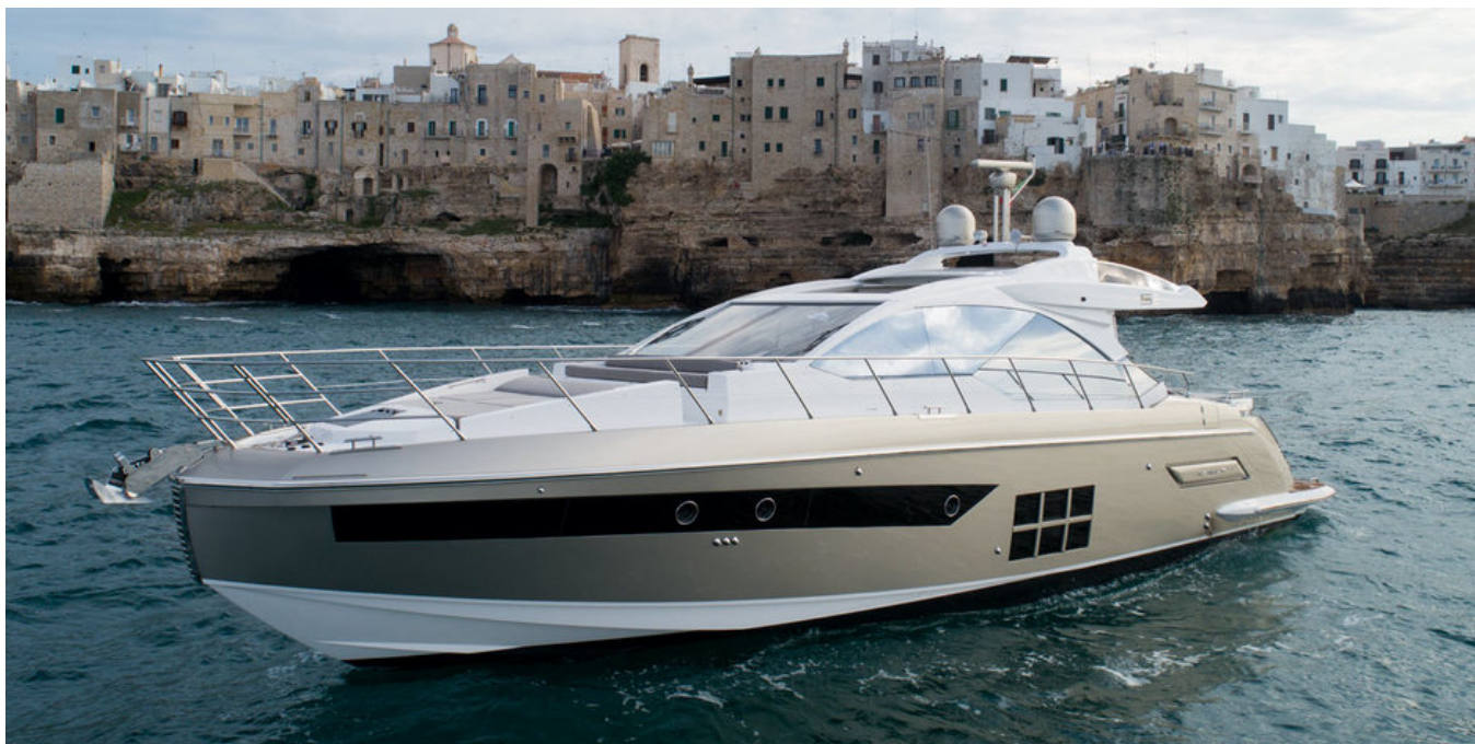
Экстерьер Azimut S6