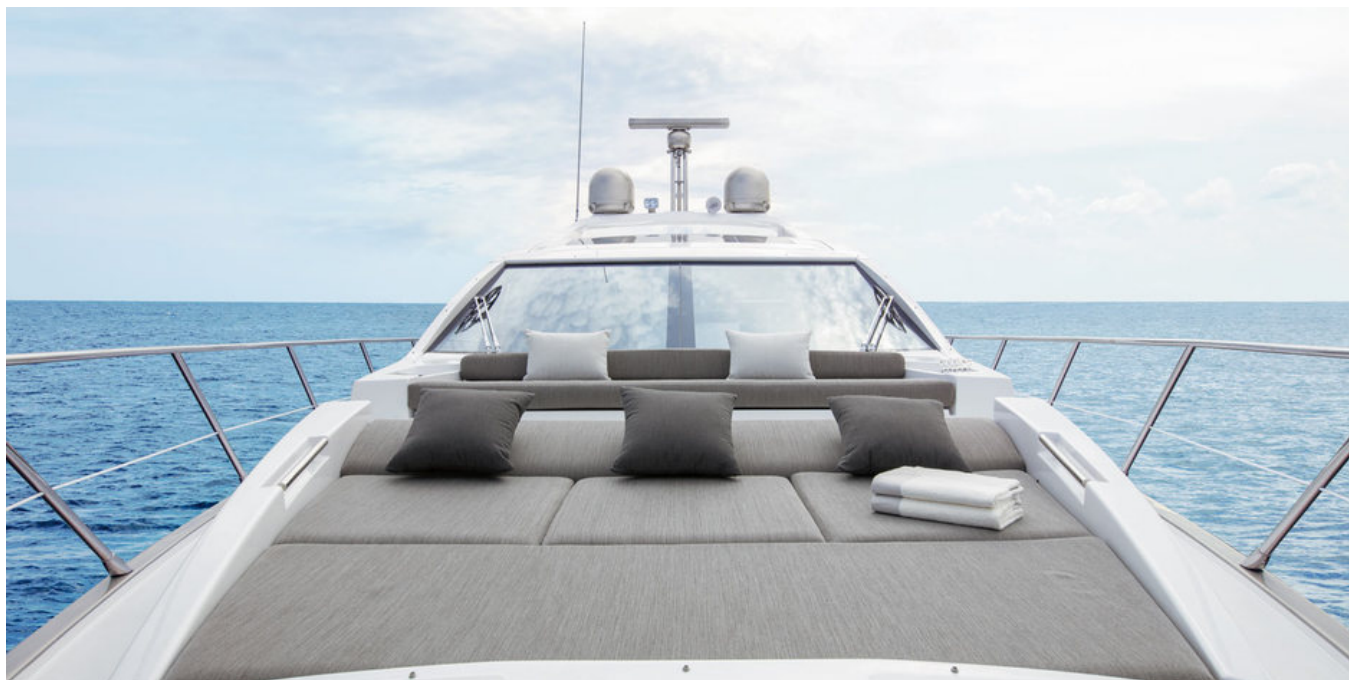
Зона для загорания на носовой части палубы