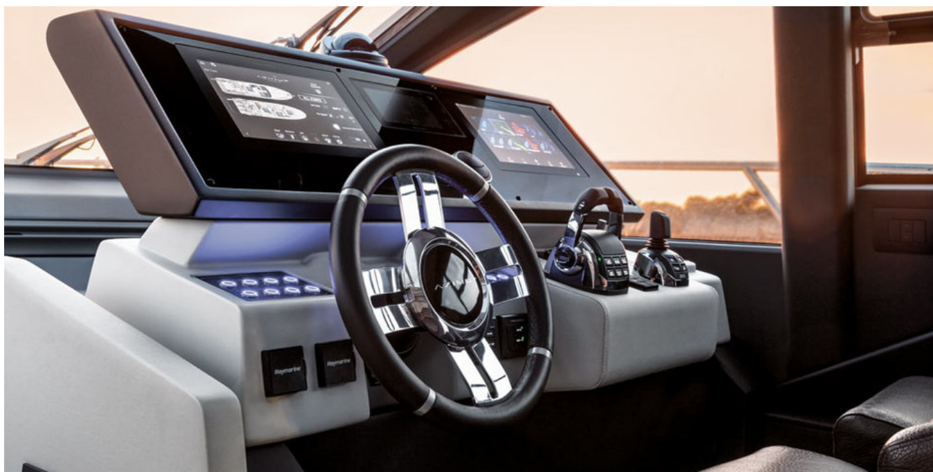
Главный пост управления