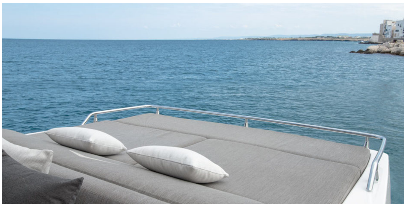
Зона отдыха на кормовой части кокпита