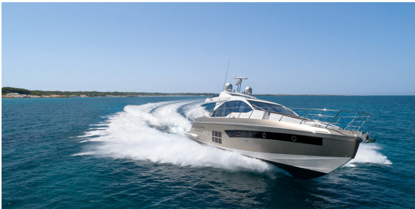
Экстерьер Azimut S6