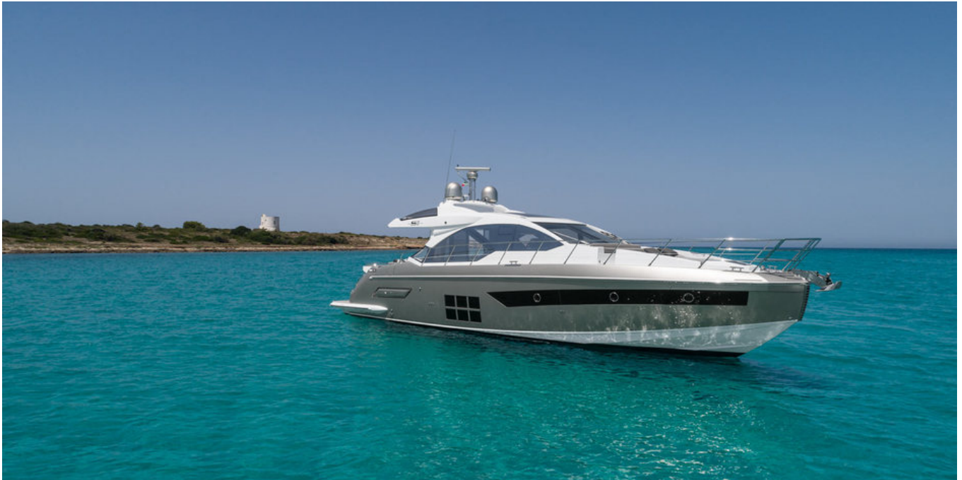
Экстерьер Azimut S6