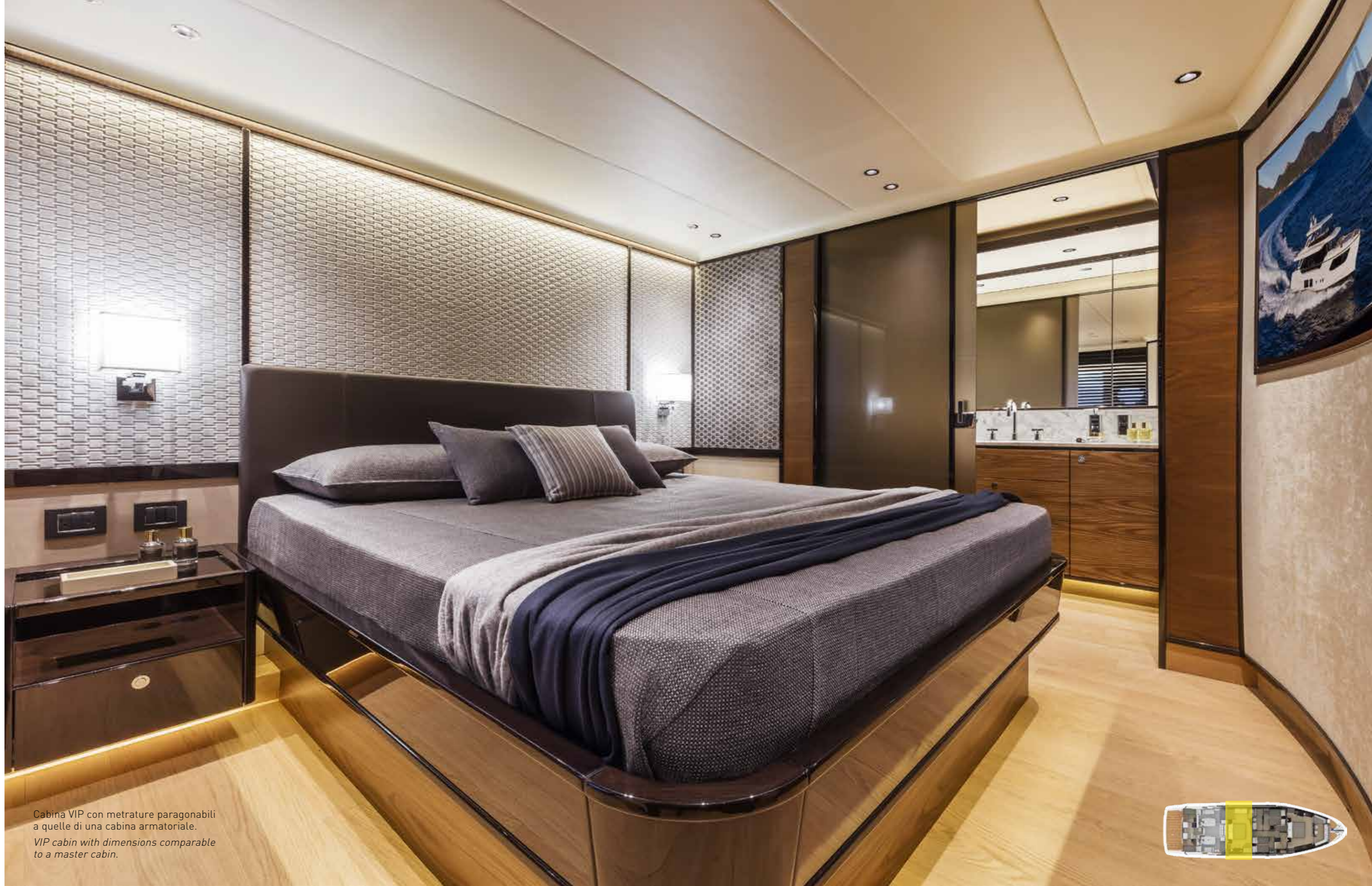
Cabina VIP con metrature paragonabili a quelle di una cabina armatoriale. VIP cabin with dimensions comparable to a master cabin.