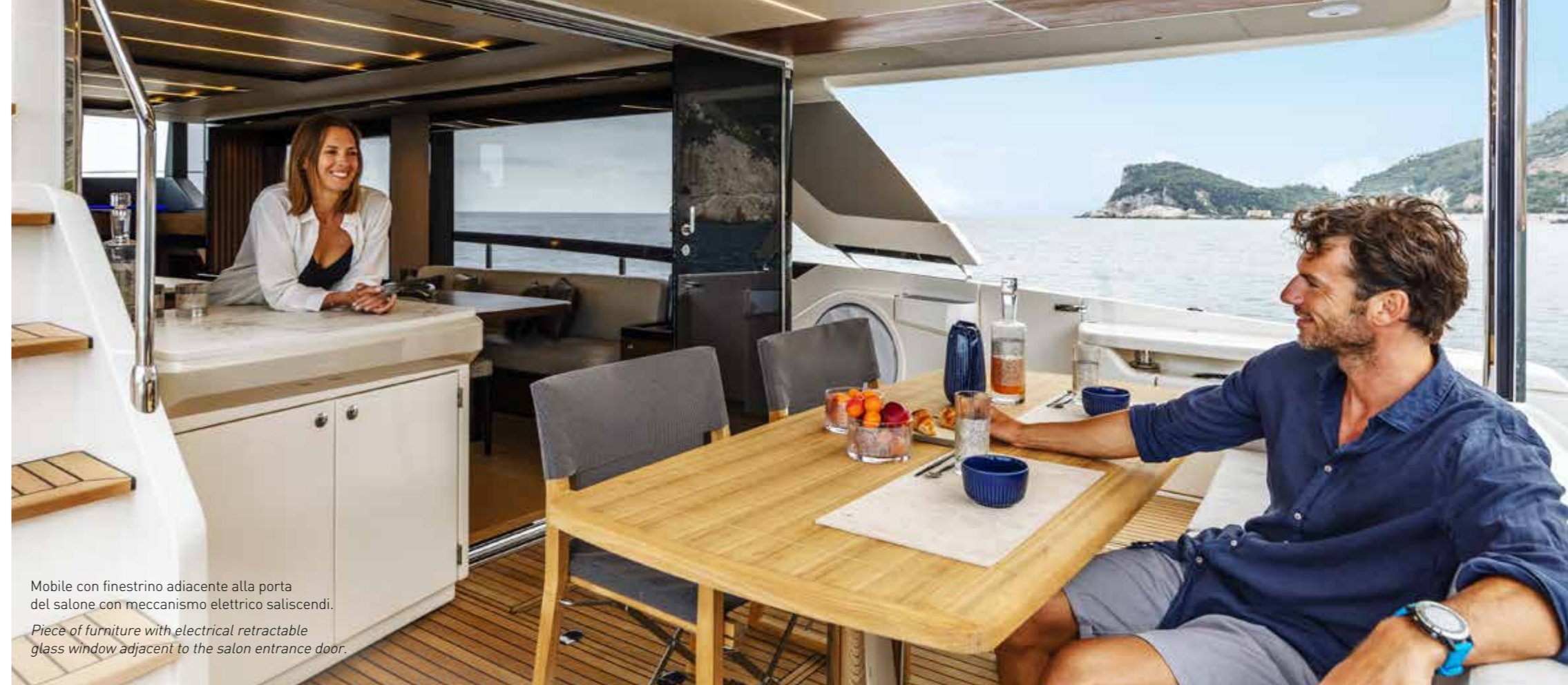
Mobile con finestrino adiacente alla porta del salone con meccanismo elettrico saliscendi. Piece of furniture with electrical retractable glass window adjacent to the salon entrance door.

“QUANDO HAI SPAZIO È PIÙ FACILE PERDERSI NEI PROPRI PENSIERI.”