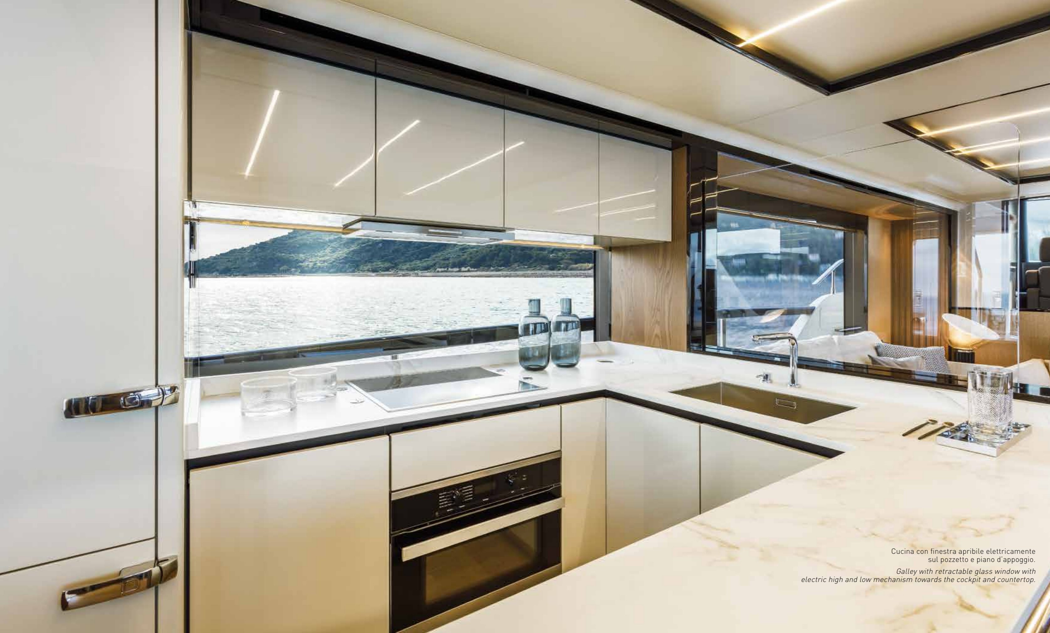
Cucina con finestra apribile elettricamente sul pozzetto e piano d'appoggio. Galley with retractable glass window with electric high and low mechanism towards the cockpit and countertop.