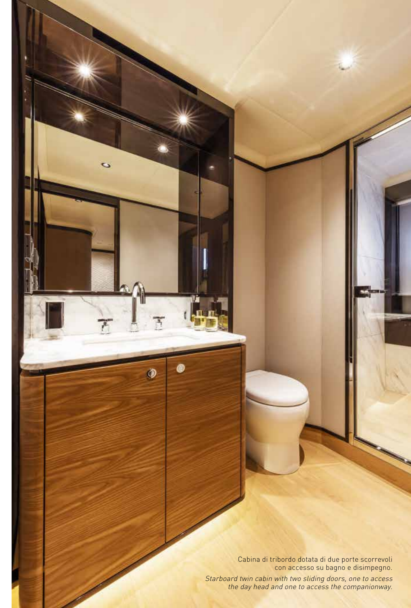
Cabina di tribordo dotata di due porte scorrevoli con accesso su bagno e disimpegno. Starboard twin cabin with two sliding doors, one to access the day head and one to access the companionway.