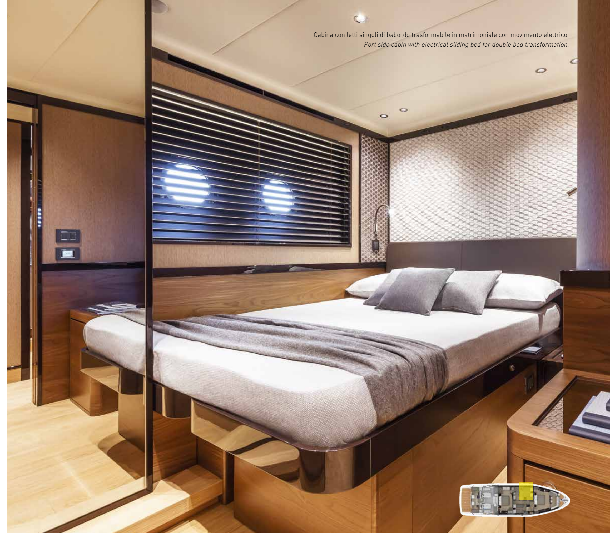
Cabina con letti singoli di babordo trasformabile in matrimoniale con movimento elettrico. Port side cabin with electrical sliding bed for double bed transformation.