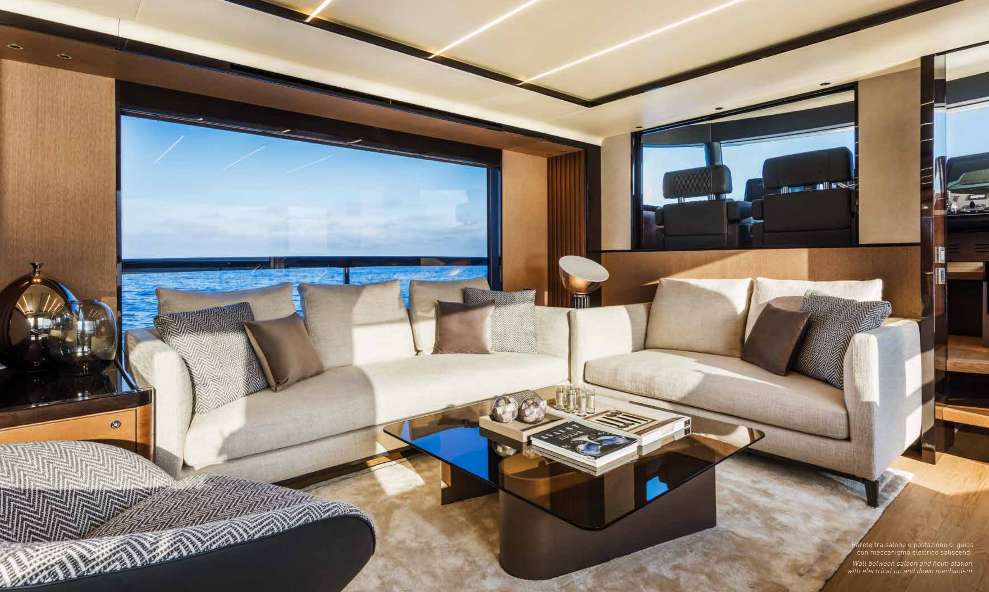
Parete tra salone e postazione di guida con meccanismo elettrico saliscendi. Wall between saloon and helm station, with electrical up and down mechanism.