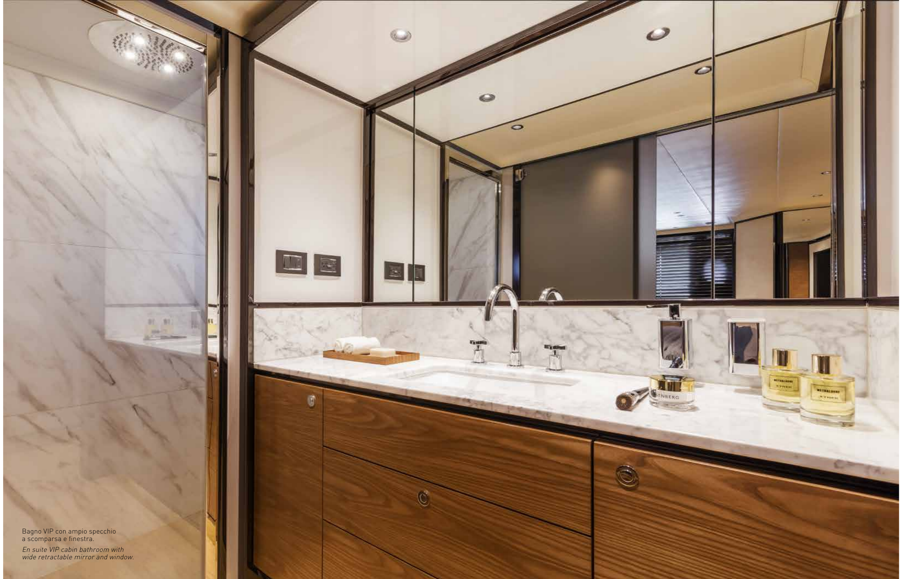
Bagno VIP con ampio specchio a scomparsa e finestra. En suite VIP cabin bathroom with wide retractable mirror and window.