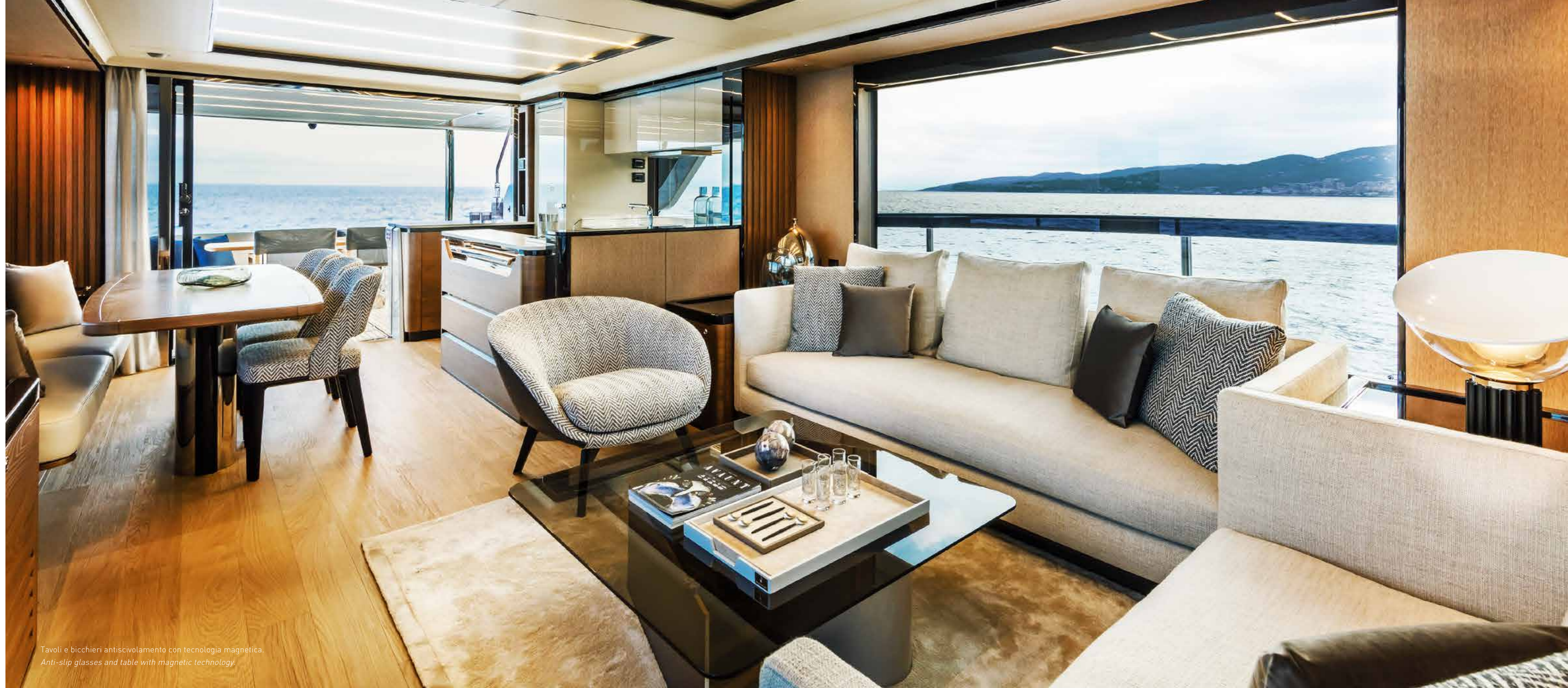
Tavoli e bicchieri antiscivolamento con tecnologia magnetica. Anti-slip glasses and table with magnetic technology.