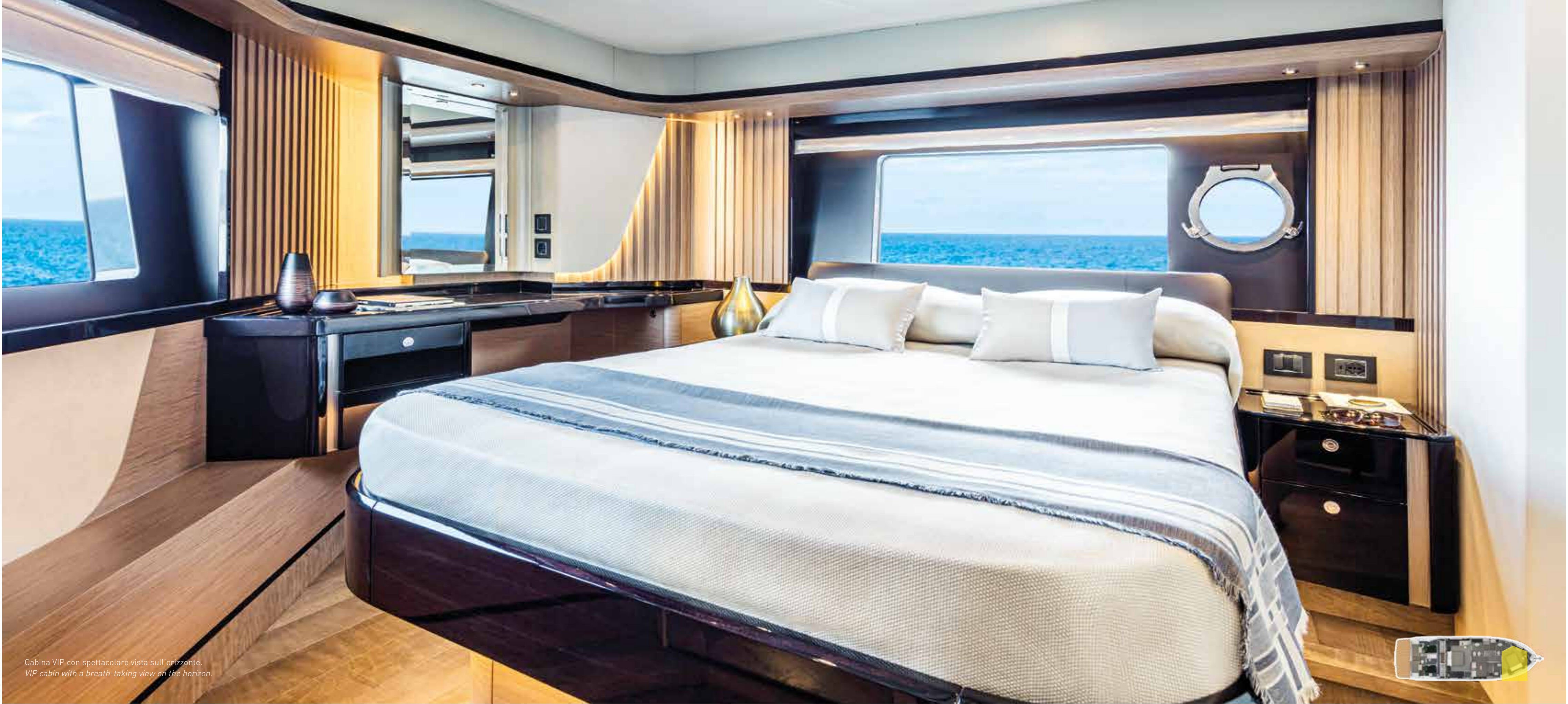
Cabina VIP con spettacolare vista sull'orizzonte. VIP cabin with a breath-taking view on the horizon.