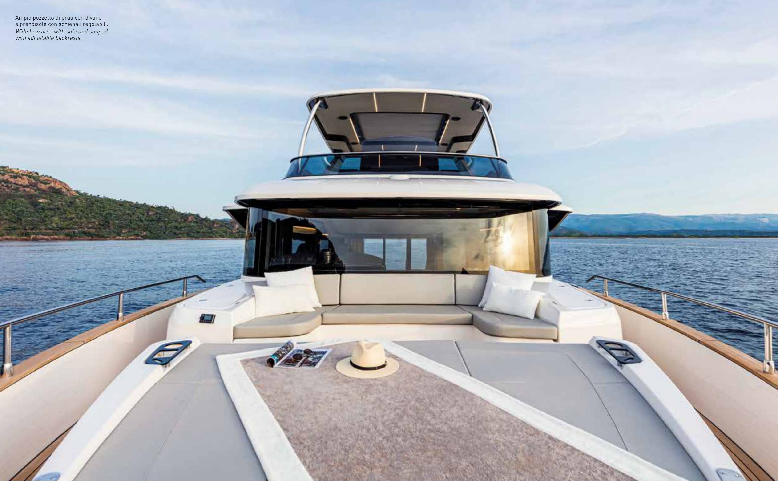
Ampio pozzetto di prua con divano e prendisole con schienali regolabili. Wide bow area with sofa and sunpad with adjustable backrests.