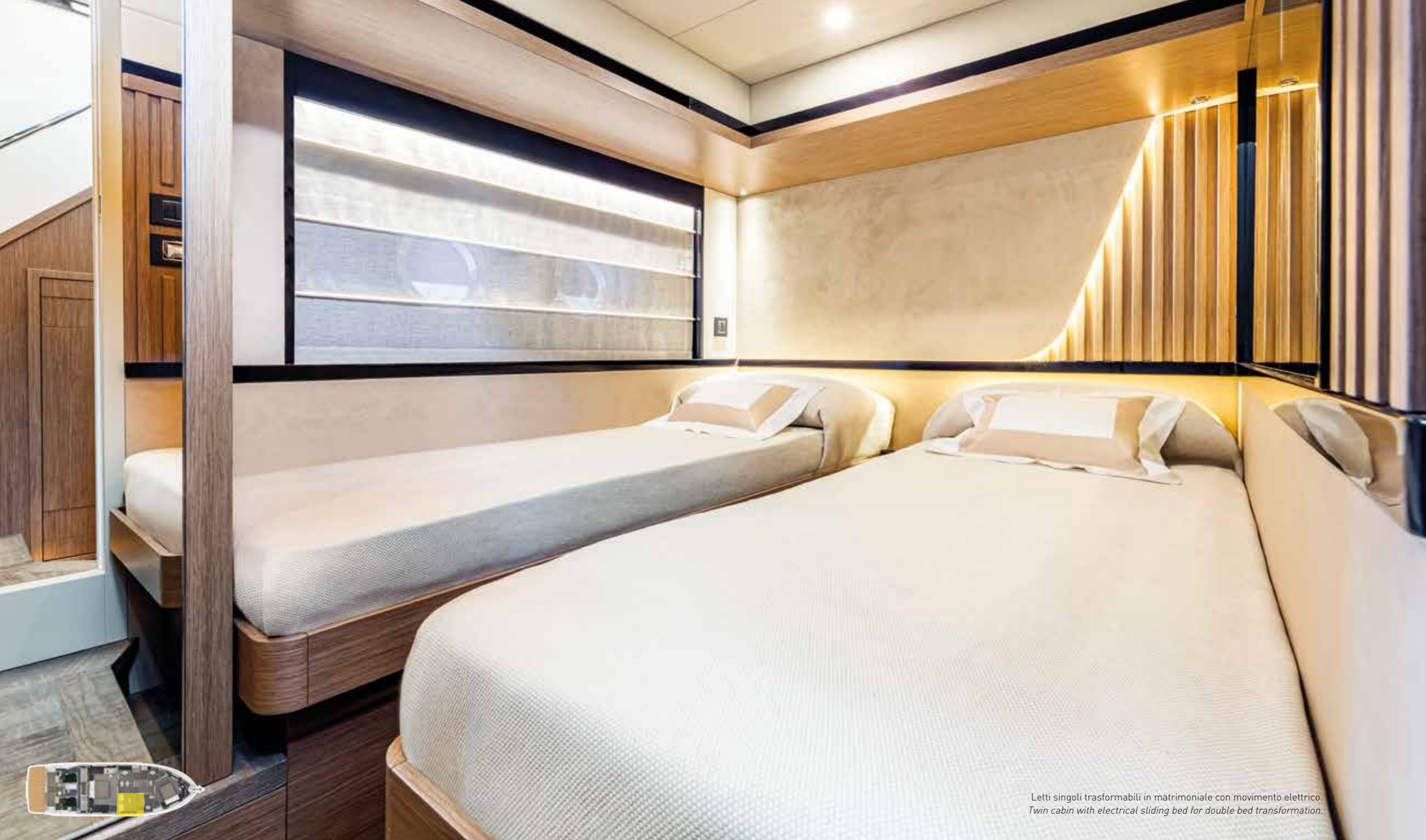
Letti singoli trasformabili in matrimoniale con movimento elettrico. Twin cabin with electrical sliding bed for double bed transformation.