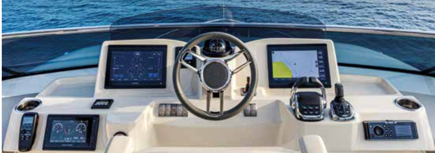
Cruscotto protetto con deflettore regolabile. Dashboard protected by height-adjustable plexiglass deflector.