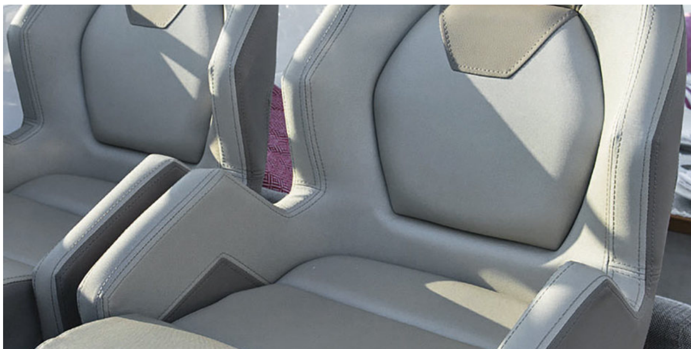
Кресла на посту управления (версия 2017)