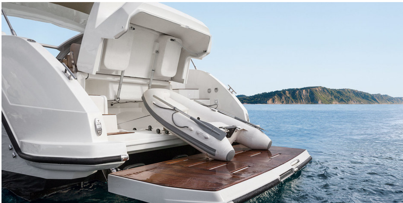
Кормовой гараж для тендера