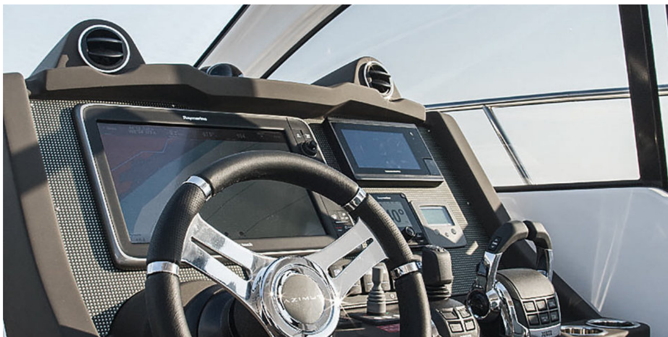
Пост управления (версия 2017)