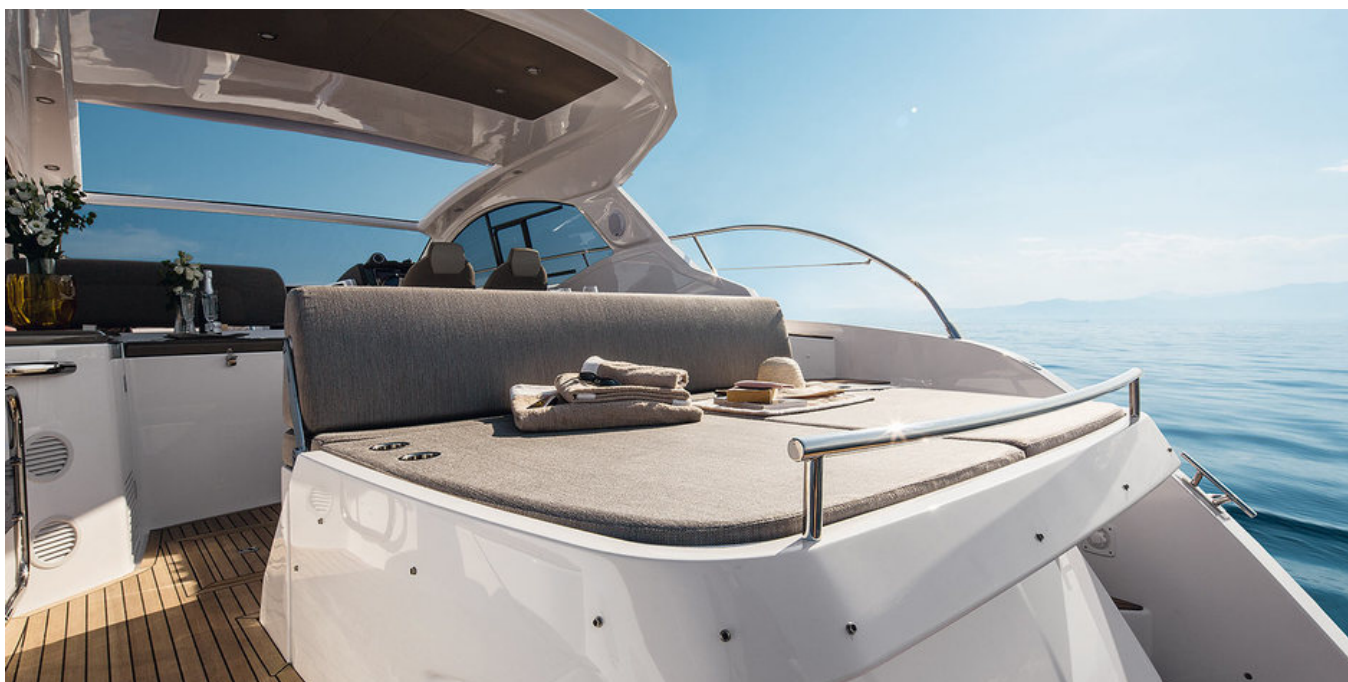
Кокпит / Кормовые лежаки из Bathyline