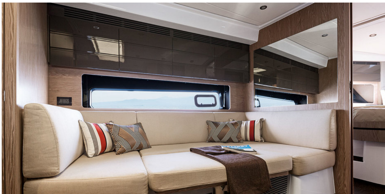
Салон на нижней палубе