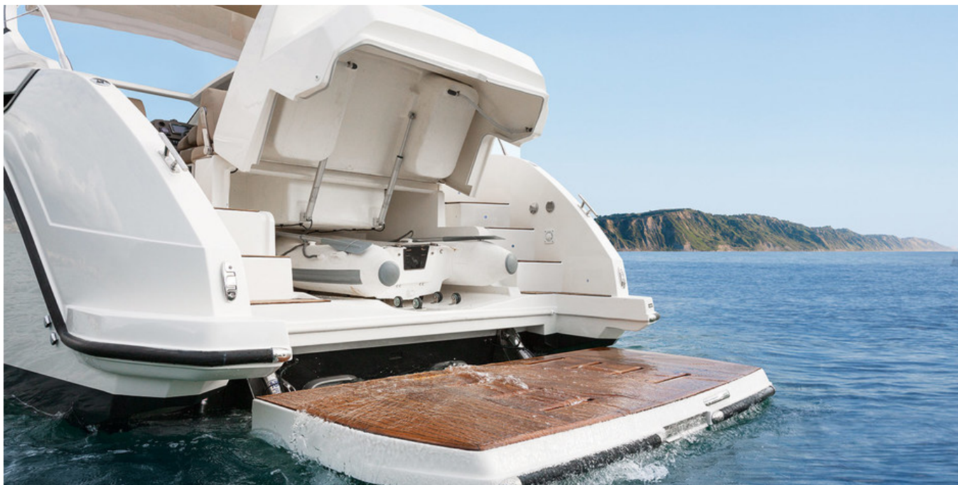
Кормовой гараж для тендера