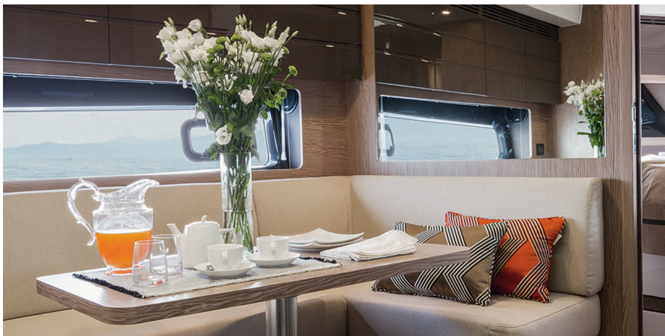
Салон на нижней палубе