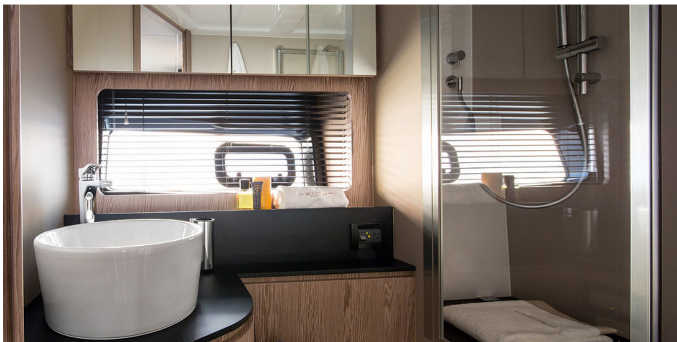
Ванная комната в каюте владельца