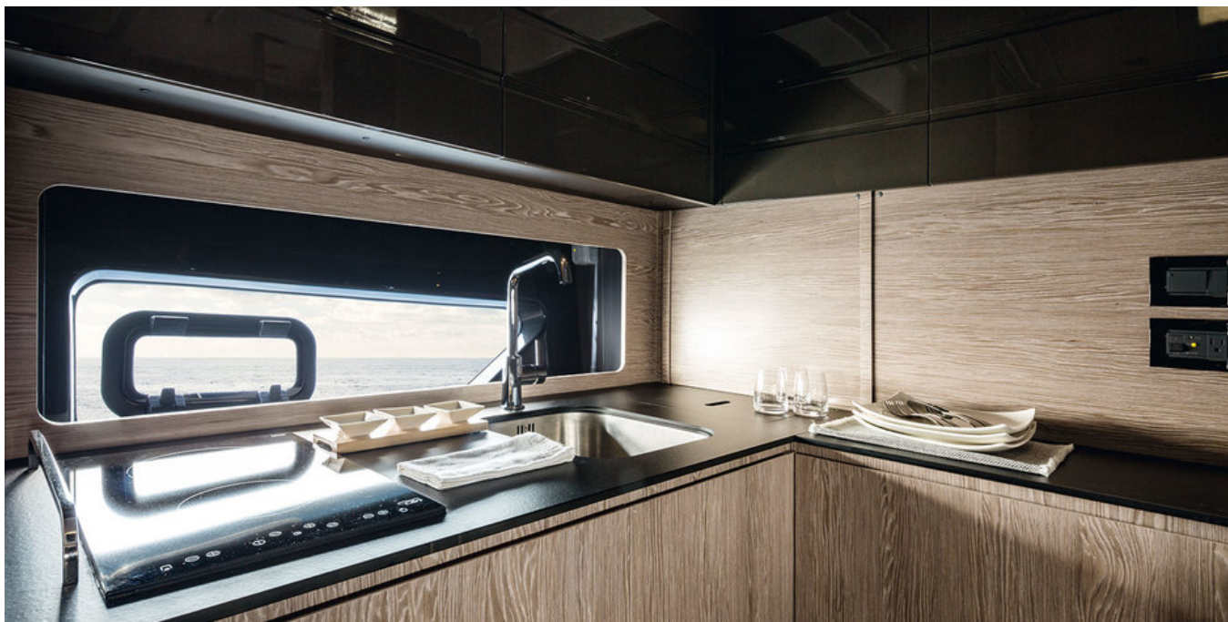
Салон на нижней палубе